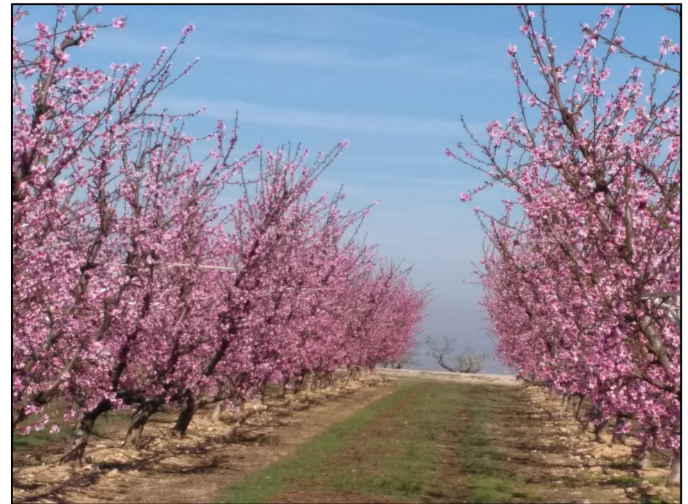
Foto: presseguers en flor a la Serra de la Pleta